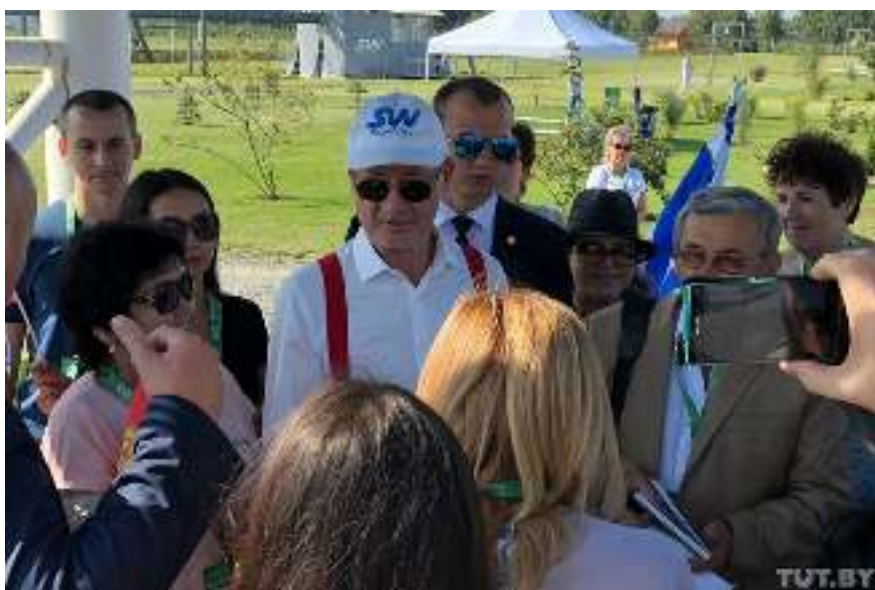
Анатолий Юницкий в кепке в центре

Главный конструктор и основатель SkyWay Анатолий Юницкий появился на ЭкоФесте примерно в 10 утра. С этого времени я периодически встречал его в разных точках парка, но каждый раз он был в сопровождении телохранителей и толпы поклонников и поклонниц, прямо как рок-звезда.