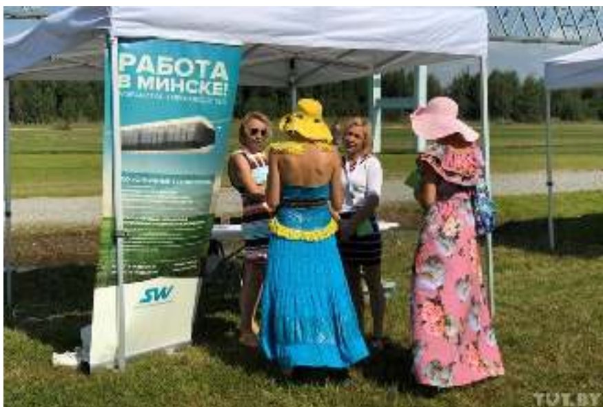
В одном из павильонов неподалеку можно было узнать о вакансиях в SkyWay

— Что сказать о Беларуси. Как всегда, вослицательно! Здесь опрятно, аккуратно, чисто. Нас родственники тут повозили по главным минским улицам. Очень понравилось. А белорусы нам родные, как может быть еще?