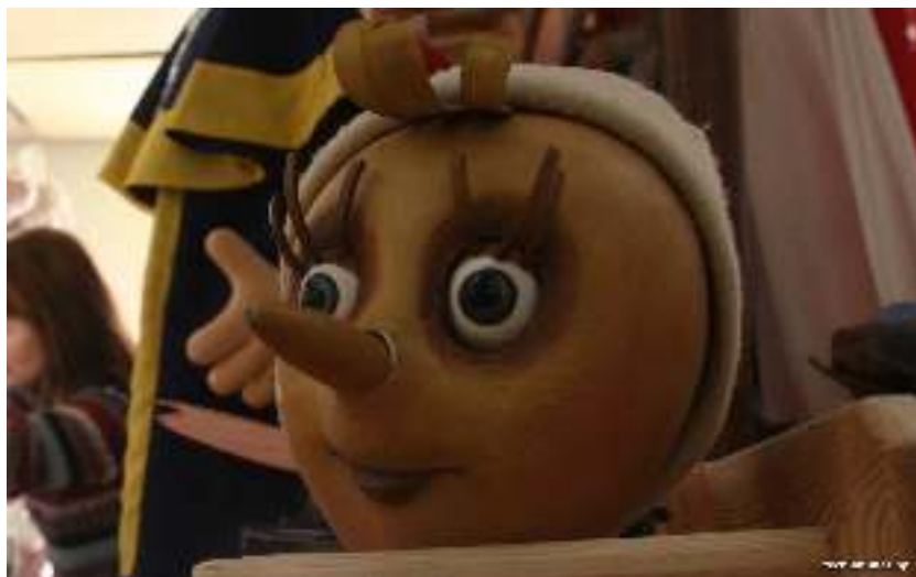
Снимок носит иллюстративный характер.

— Все оформляла в личном кабинете SkyWay Capital. Регистрируешься там, выбираешь пакет с акциями в рассрочку и каждый месяц платишь. Никаких документов, конечно, не было. Акции никак не оформлялись. Всего вложила $6600, платила, судя по счету, физическому лицу.