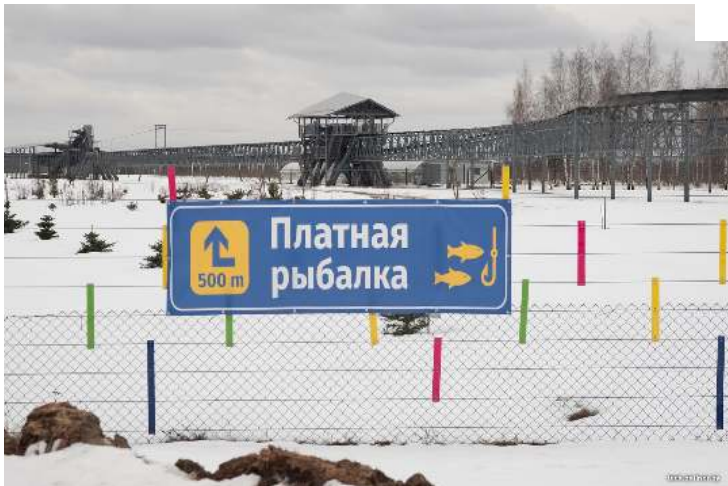
Интеллектуальный струнный забор в конце концов прикрыли обычной сеткой-рабицей, как на вашей даче

Несколько слов про рыбалку. Реально классно! Пусть со струнами и транспортом не вышло, но отдохнуть и половить рыбку можно с удовольствием. Вода чистойшая, щука беленькая, работники очень доброжелательны, организация на высоте. Чаем и кофе напоят бесплатно, дров для мангала подкинут.