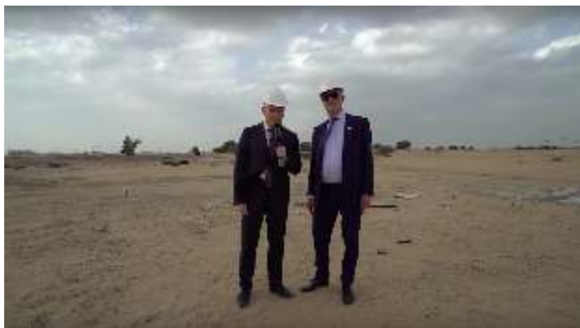
Еще одно фото с места строительства инновационного транспорта.

По информации Onliner, проекту SkyWay действительно на каких-то условиях выделили участок земли в Эмиратах. Наш источник утверждает, что SkyWay активно ищет местных специалистов-инженеров, знакомых с особенностями возведения массивных металлических конструкций в пустыне. По его словам, из-за сомнительной репутации профессионалы отказываются от сотрудничества с компанией. Возможно, именно поэтому на выделенном участке по состоянию на февраль так и не появилось ни одного метра струнной дороги. Зато есть флажки с полотнищами SkyWay и яма. Еще по пустыне время от времени (перед камерой, снимающей очередное интервью академика разных академий) ездит бульдозер.